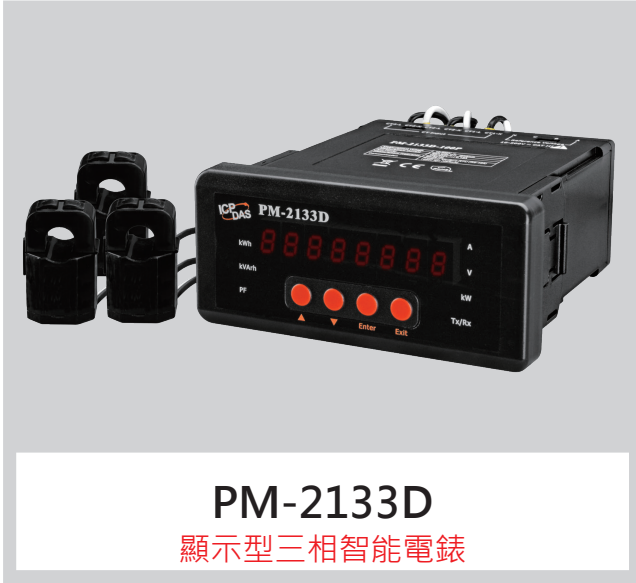
PM-2133D 顯示型三相智能電錶