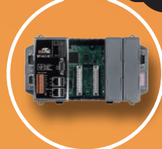
可程式自動化控制器