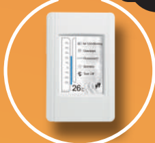
觸控人機介面裝置