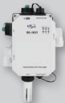
工業級空氣盒子 DL-1000 系列